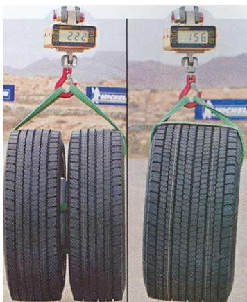
(軽量化のイメージ画像)

ダブルタイヤ仕様と比較しタイヤ・ホイールユニット総幅が縮小されるため、左右タイヤ間距離が増大しシャーシ設計の自由度が拡大します。また、シングル化により部品点数が減り車両の生産性も高められます。